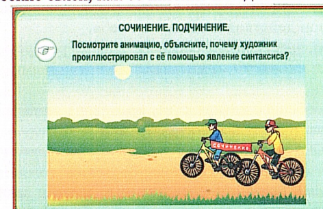
Два велосипедиста могут ехать вместе и по отдельности.

Интерактивные иллюстрации, или анимации, также позволяют объяснить новую тему, не прибегая к использованию готовых определений. Например, иллюстрация по теме «Виды синтаксической связи» демонстрирует такие синтаксические связи, как сочинение и подчинение.