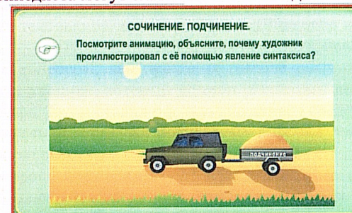
А машина с прицепом могут ехать только вместе.