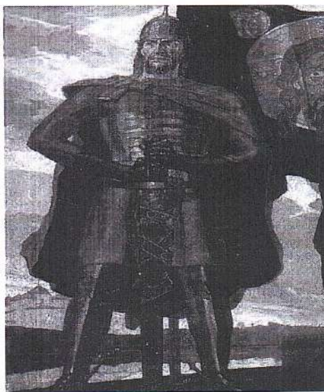
Рисунок 1 – Александр Невский

Задание № 1. Представьте, что вы чудесным образом очутились на месте новгородского князя Александра Ярославовича, прозванного Невским (рисунок 1). На вашу долю выпало тяжелое время. Русь находящаяся в состоянии феодальной раздробленности, подверглась нападению с трех сторон: католического запада, Золотой орды и Литвы. Противостоять всем врагам одновременно вы не можете. Как бы вы поступили в данной ситуации, находясь на месте князя. Дайте развернутый ответ, подробно описав план своих действий.