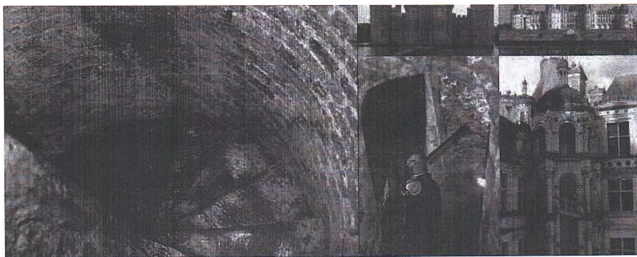
Рисунок 2 – Средневековые винтовые лестницы

Задание № 2. Средневековую эпоху невозможно представить без рыцарства, а рыцарство невозможно представить без замков и крепостей. Талантливые зодчие того времени старались продумывать строение данных сооружений до мелочей. На рисунках перед вами представлены фотографии средневековых винтовых лестниц. Практически все они имеют одну особенность – они закручены по часовой стрелке (рисунок 2). Дайте развернутый ответ, с какой целью по вашему мнению это сделано?