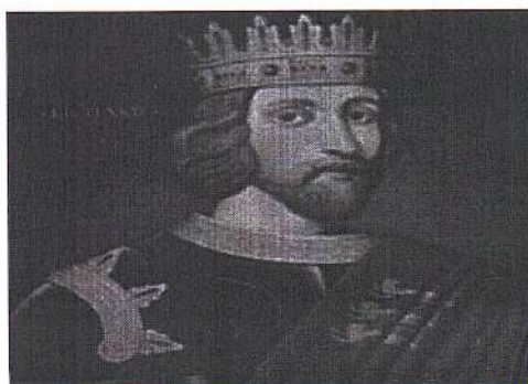
Рисунок 4 – Ричард I

Задание № 4. Люди издавна пытались выразить окружающий их мир и события происходящие с ними при помощи образов и знаков. Так первобытные люди при помощи изображения определенного зверя пытались выразить его качества: силу, ловкость, храбрость. Эта традиция существовала у многих на родов. Так английский король, Ричард I (рисунок 4), за проявленную храбрость и благородство получил прозвище «Львиное сердце».